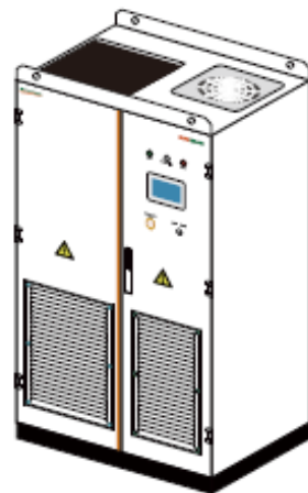
Fig. 4-3 Illustration of the Standard Design